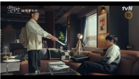
방송사 프로그램 (드라마, 예능 등)