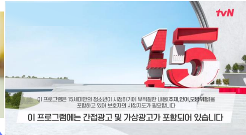
방송사 프로그램 (드라마, 예능 등)